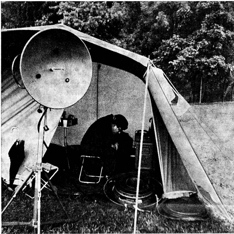
Die drei Schnappschüsse auf dieser Seite stammen vom fachtechnischen Kurs R-902 der Sektion Zürichsee rechtes Ufer

melite-Elektrisch» erschienen) das Wasser aus einem Regensammler in die Küche pümpeln muss, doch gemessen am zynischen Kommentar der Kameraden wurde der Frass genossen. Es soll eine beachtliche Anzahl Käfer, Spinnen, halbe Daumen und Haare aller Färbungen in den Knöpfli gewesen sein, wenn man den Kommentaren glauben darf. Der laue Sommerabend mit Mondschein lockte männlich (und weiblich) vors Haus, und der gemütliche Abend fand samt Umtrunk im Freien statt. Am Morgen gab's Kaffee, Milch, Käse, Butter und Confi mit Brot, und während nun die Kameraden funkgesteuert zu Fuss laufend neue Standorte zu suchen, zu beschreiben und Notizen zu machen hatten, zur grossen Freude eines Grenzwächters ohne Grenzverletzung mit den damit verbundenen Schwierigkeiten zwischen Bonn und Bern, präparierte das Küchenbullen-team, der Hitze wegen in der Badehose, einen währschaften Spatz und Tee citron, der einen rechten Sprutz 80 %-Rum enthielt, sehr zur Freude der bald darauf eintreffenden etwas abgekämpften Wanderkollegen, spricht Funkpatrouillen.