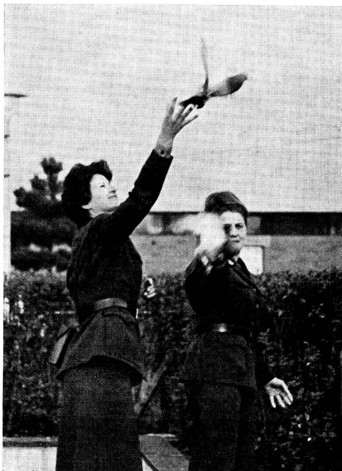
Auch die Brieftauben werden eingesetzt!