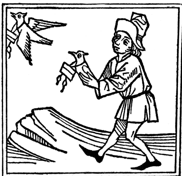
Absenden von Brieftauben

Von 1961 bis 1967 sind die schweizerischen Ausgaben für die militärische Landesverteidigung ohne Berücksichtigung der Aufwendungen für den Zivilschutz und die Bundespflichtlager um 50 % von 1,1 auf 1,7 Mrd. Fr. gestiegen. Demgegenüber haben die gesamten Bundesausgaben in der gleichen Zeitspanne um 73 % von 3,3 auf 5,7 Mrd. Fr. zugenommen. Der Anteil der Militärausgaben an den gesamten Bundesaufwendungen ging somit von 33,5 % auf 28,2 % zurück. Interessant ist, dass die schweizerischen Militärausgaben sowohl im Verhältnis zu den Bundesausgaben als auch im Verhältnis zum Volkseinkommen eine sinkende Tendenz aufweisen. Der Anteil der Militärausgaben am Volkseinkommen ging von 1961 bis 1967 von 3,1 auf 2,9 % zurück.