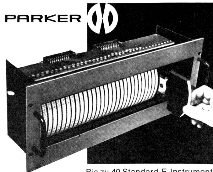
Bis zu 40 Standard-E-Instrumente nimmt dieser «Miniscan» 19-Zoll-Einschub auf. Dadurch spezielle Eignung für Überwachungsfunktionen.

Verlangen Sie Prospekte und Preislisten vom Generalvertreter mit Auslieferungslager: