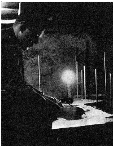
Ob wohl die brennende Kerze dazu benützt wurde, die Stromversorgung der SE-206 sicherzustellen?

Hier bloss ein kleines Detail: Der Rundspruch musste von einigen Stationen quittiert werden. Weil das bei verschiedenen wahrscheinlich nicht auf den ersten Anhieb gelang, musste die Zeit über das befohlene Funkverbot hinaus ausgedehnt werden. Drei Stationen haben nach dem befohlenen Funkverbot den Rundspruch erst quittiert, nachdem die Rundspruchstation sie dazu aufgefordert hat. Diese drei Stationen haben sich richtig verhalten. Die Phase Gelb bot an und für sich keine Schwierigkeiten.