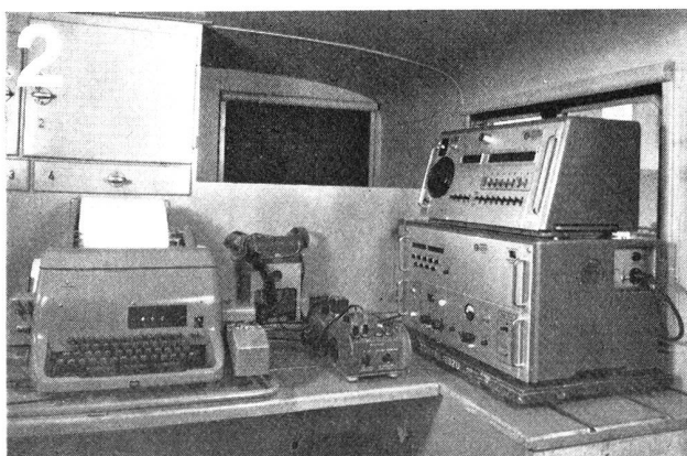
Zellweger AG., Uster/ZH Apparate- und Maschinenfabriken Uster