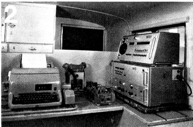
Zellweger AG., Uster/ZH Apparate- und Maschinenfabriken Uster