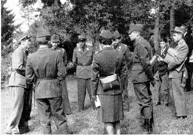
Flotter Einsatz bis zum Schluss: Letzte Weisungen an die Stations- und Gruppenführer vor dem Übungsabbruch im Nebenzentrum Zug.

Sektionsmitglieder, die die Rekrutenschulen absolvieren, Gelegenheit erhalten, ihr Können bei den Sektionskameraden demonstrieren zu können.