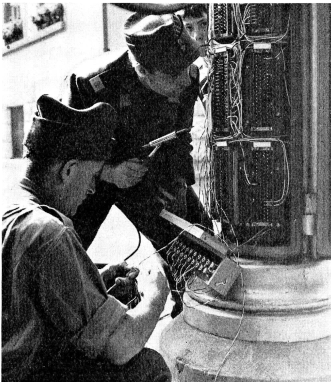
Glücklich sind diejenigen Sektionen, die in ihren Reihen Fachleute besitzen, die die Zivilanschlüsse selber herstellen können. Im Hauptzentrum I waren insgesamt 13 Anschlüsse zu bewerkstelligen.