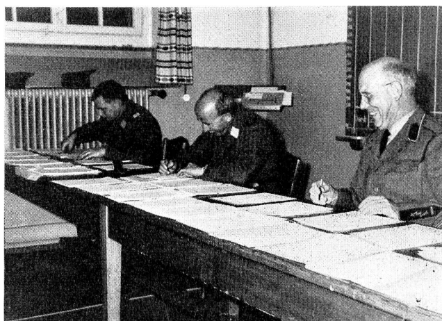
Für eine gute Ausnützung der Verbindungen war ein Funktionieren der Telegrammkontrolle ausschlaggebend. Trotz umfangreicher Arbeit (die drei hatten 19 Verbindungen zu betreuen) langte es noch zu einem Spass, wie unser Bild zeigt.