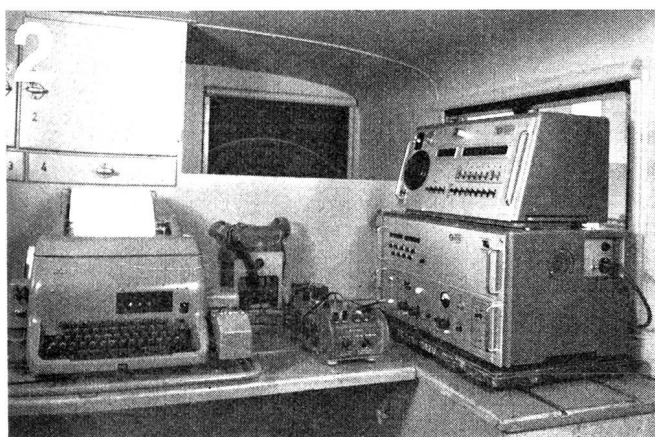
Zellweger AG., Uster/ZH Apparate- und Maschinenfabriken Uster