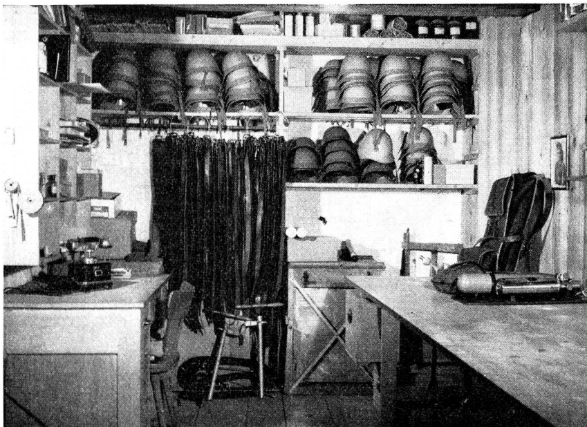
Kleider- und Materialmagazin des Zivilschutzes in Sursee