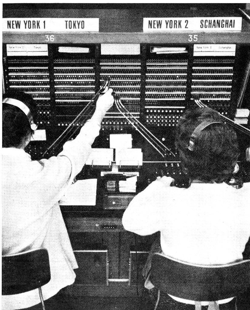
B+C III 1

Die patentierten Electrona-Dural-Doppelröhrchenplatten wurden unter härtesten Bedingungen tausendfach geprüft. Die elastischen Kunststoffröhrchen widerstehen einem Druck von über 50 atü und sind vollkommen säurefest. Daher verhüten sie die Schlamm- und Gasbildung und garantieren absolute Sicherheit und maximale Lebensdauer.