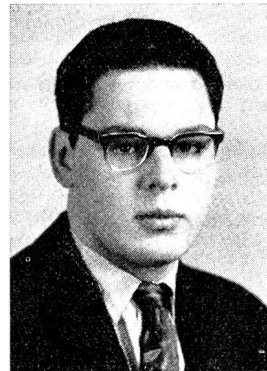
Wir haben die schmerzliche Pflicht, Sie vom Hinschied unseres lieben Kameraden

Voranzeige. Bft.-Totoflug am 10. Juli, vormittags. Es soll wiederum sehr spannend werden. Näheres im nächsten «Pionier». J.F.