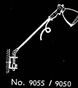
No. 9055 / 9050