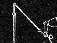
No. 9056 / 9050