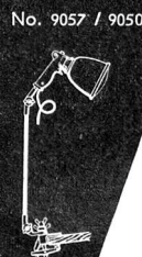
No. 9057 / 9050