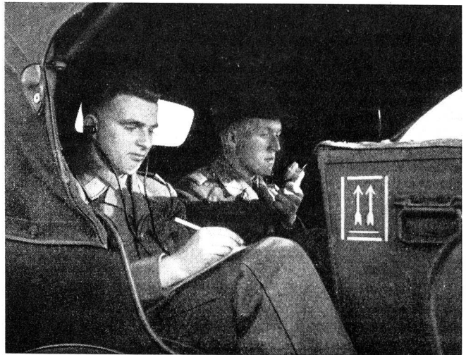
Zwei Funker bei der Bedienung einer im Auto eingebauten Fix-Station