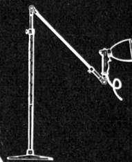
No. 9056 / 9050