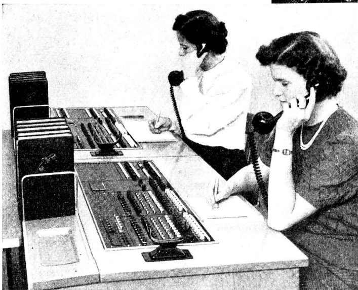
Neue schnurlose Vermittlungseinrichtung mit Zahlengeber für Telephonanlagen mit 20 Amtsleitungen.