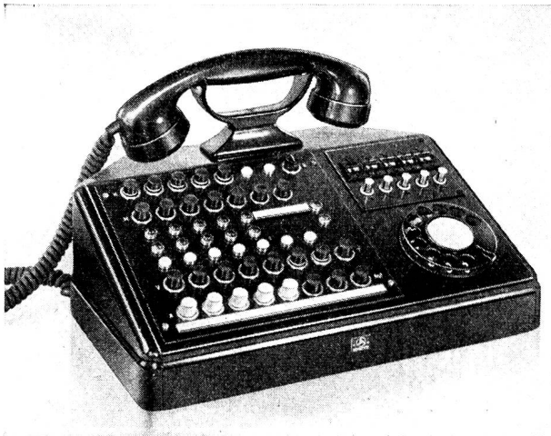
Vermittlungsstation für Telephonanlagen mit 5 Amtsleitungen.

Tausende von kleinen und grossen Betrieben der verschiedensten Branchen, haben uns bis heute mit der Planung und Erstellung ihrer Telephonanlagen betraut. Unsere erfahrenen Fachleute lösen auch Ihre Telephonprobleme zweckmässig und rationell unter Berücksichtigung der Eigenart Ihres Betriebes.