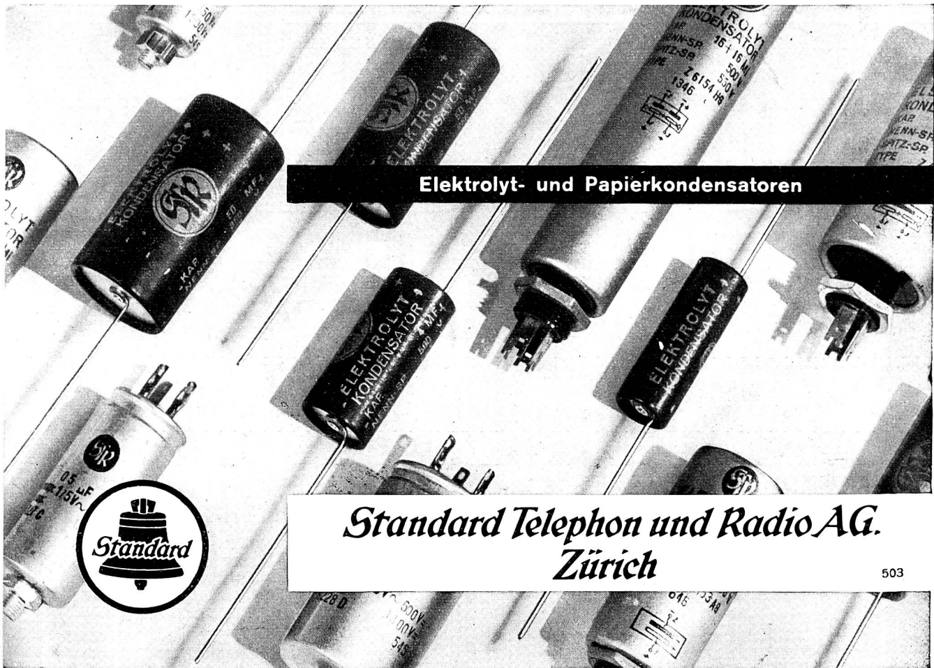
Elektrolyt- und Papierkondensatoren

RIEDEN bei Baden, Aarg. - Tel. (056) 2 47 52