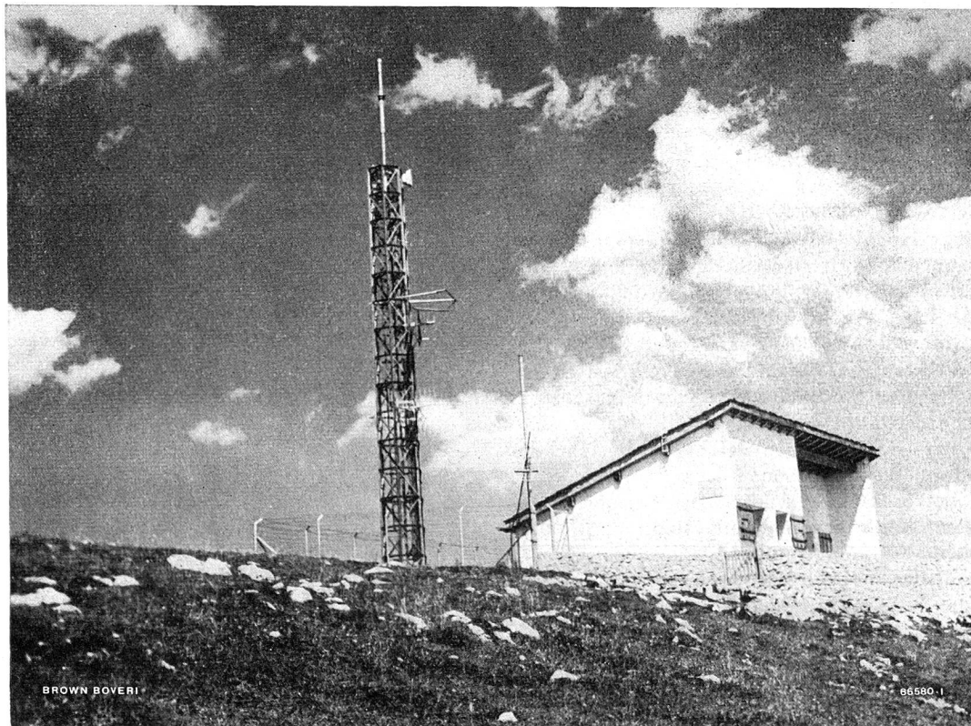
Unbediente Relaisstation auf dem Chasseral für die drahtlose Telephonverbindung mit der Endstation Genf und der Relaisstation Uetliberg.

Weise wie die Relaisstation Uetliberg arbeitet. Bei der Endstation Genf, die im Estrich der Telephonzentrale Mont-Blanc installiert ist, werden die Hochfrequenzsignale vom Chasseral von der auf dem Dach aufgestellten Empfangsantenne aufgenommen, über ein kurzes Hochfrequenzkabel dem Empfänger zugeführt und demoduliert. Das aus den sechs Gesprächen bestehende Mehrfachsignal wird in der Trägerfrequenzanlage wieder in die einzelnen sechs Telephonkanäle getrennt, welche über normale Gabel- und Rufeinrichtungen zum Linienwähler der Genfer Telephonistin geführt werden. Die totale Länge der drahtlosen Verbindung Zürich—Genf beträgt zirka 241 km und sämtliche Drahtverbindungsleitungen innerhalb der genannten Stationen nur zirka 150 m.