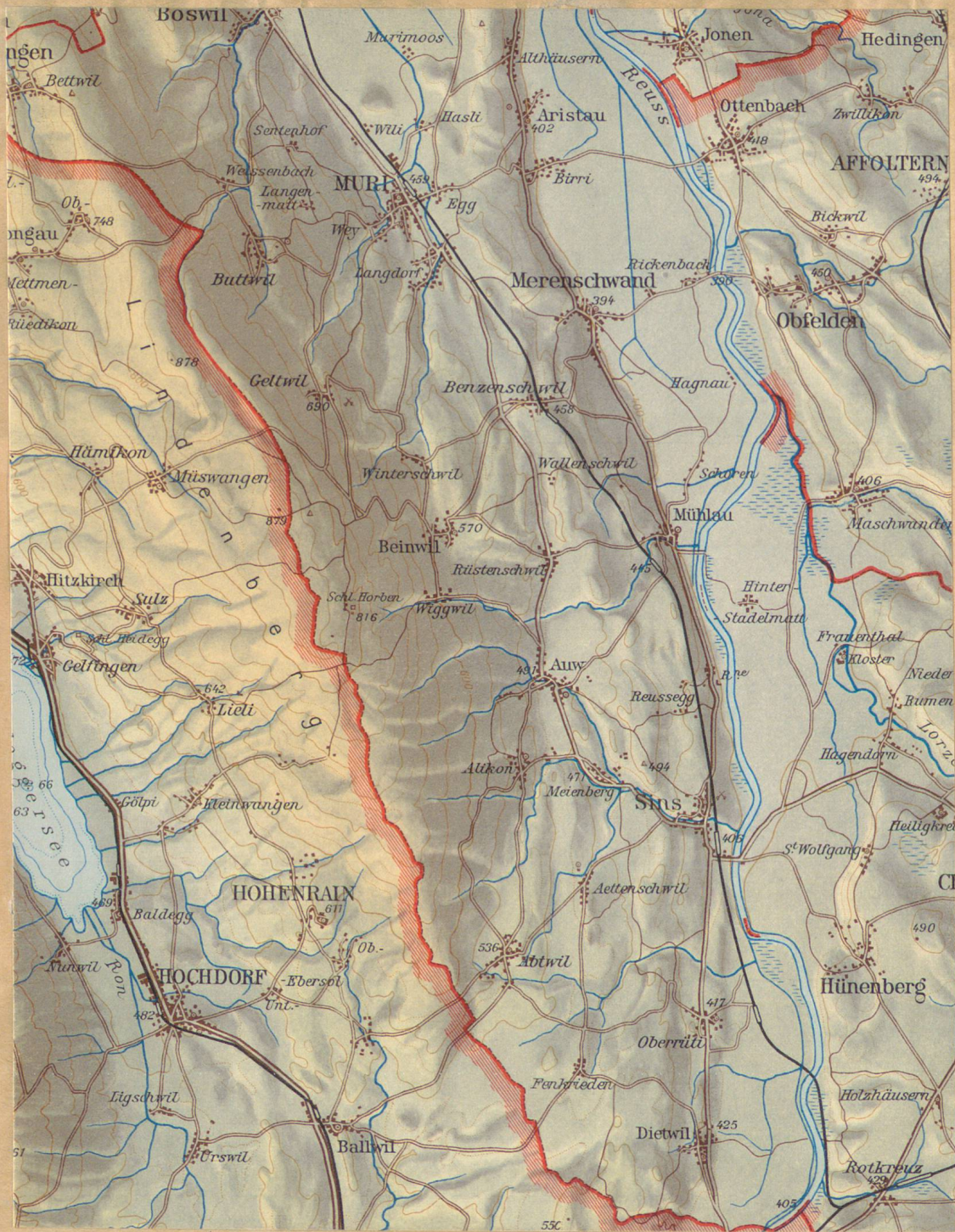
Originalbeilage zum Artikel über die Arbeit der privaten Kartographie in der Schweiz. Ausschnitt aus der Schulkarte des Kantons Aargau. Herausgegeben von der Erziehungsdirektion des Kantons Aargau. Kartographie und Druck: Kümmerly & Frey, Bern.