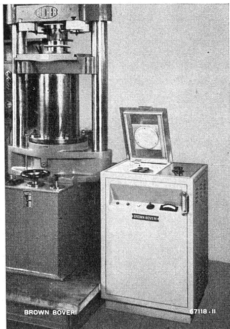
Mit diesem 1-kW-Hochfrequenz-Röhrengenerator wird das in der Kunststoff-Fabrikation verwendete Presspulver in kürzester Zeit durchwärmt und plastisch. Der anschliessende Pressprozess wird abgekürzt und die Produktion gesteigert.

mehreren Jahren mit Erfolg arbeitet, orientieren einige instructive Ausstellungsobjekte. Ein vielseitiges Spezialgebiet stellt z. B. die Herstellung von luft- und wassergekühlten Sende- und Spezialröhren dar; sie werden in werkeigene Rundfunksender für Mittel-, Kurz- oder Ultrakurzwellen, in Sender der kommerziellen Telegraphie, in HF-Röhrengeneratoren für industrielle Zwecke eingebaut und eignen sich auch