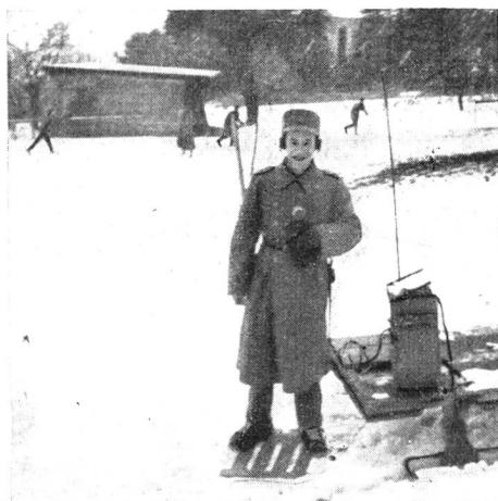
VI R 17568

Am 11. Februar gelangte in Hinwil der Militärskihindernislauf zur Austragung, organisiert von der Sektion Zürcher Oberland des UOV. Unsere Sektion übernahm mit 12 Kameraden den Uebermittlungsdienst. Der Funkverkehr wurde durch ein 2er- und ein 3er-Netz bewältigt. Auf dem Schiessplatz wurde eine Telefonverbindung erstellt, und am Ziel konnten die eingegangenen Meldungen durch einen Lautsprecher bekanntgegeben werden. Die Aussenstationen befanden sich beim Handgranatenwurfplatz, auf dem Schiessplatz und bei der Bretterwand, alles Standorte, von denen interessante Meldungen durchgegeben werden konnten. Das ganze Netz funktionierte während mehr als 5 Stunden ohne jegliche Störung. Die 3 Bilder zeigen Aufnahmen während des Wettkampfes und stammen von unserm Mitglied Benny Guggenheim, Zürich.