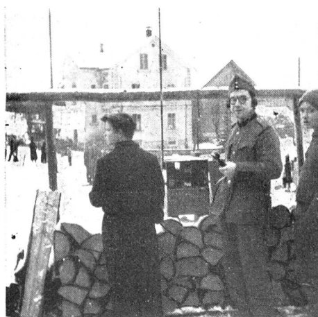
VI R 17569