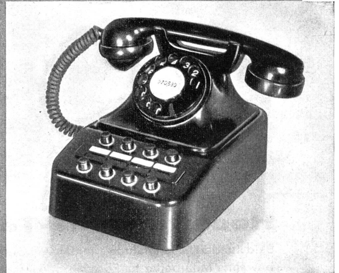
Kleine, kombinierte Direktions- und Sekretär-Tischstation für Amts-, Haus- und Querverbindungsleitungen.

VERTRIEB DURCH: SIEMENS ELEKTRIZITATS-ERZEUGNISSE A.-G., ZÜRICH, BERN, LAUSANNE