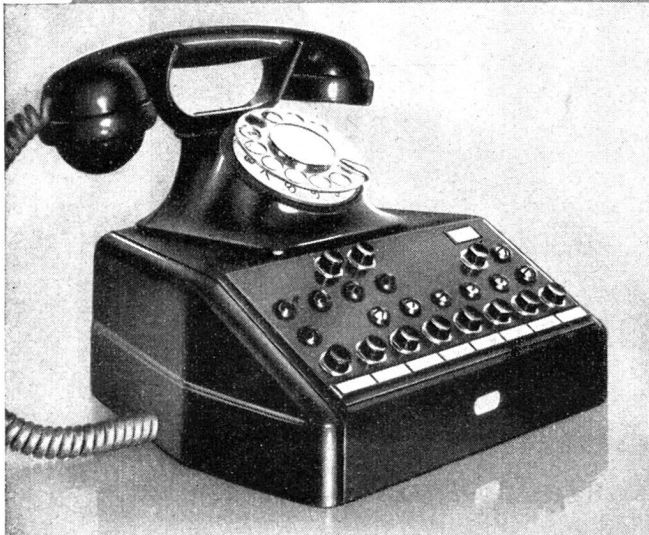
Große, kombinierte Direktions- und Sekretär-Tischstation für Amts-, Haus- und Querverbindungsleitungen.