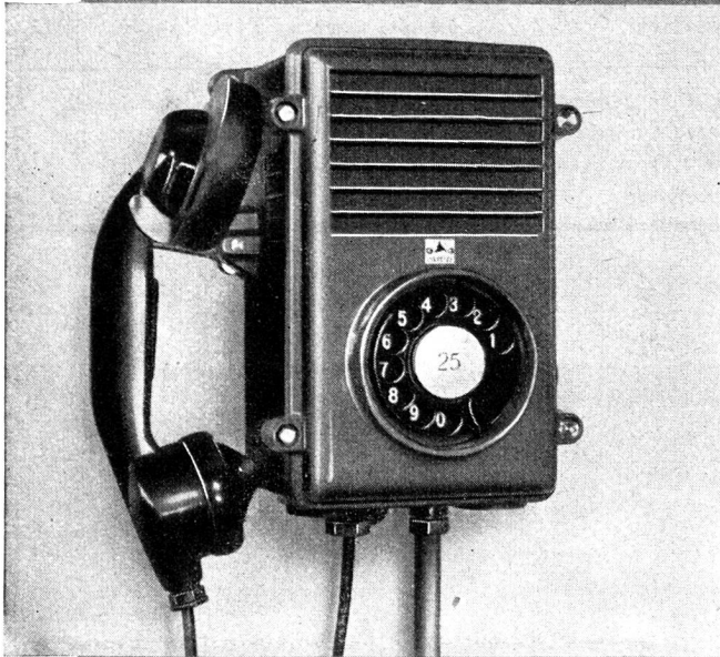
Feuchtigkeitsbeständige Wandstation für feuchte Räume und Freiluftbetriebe wie Bahnanlagen, Elektr.-Werke usw.