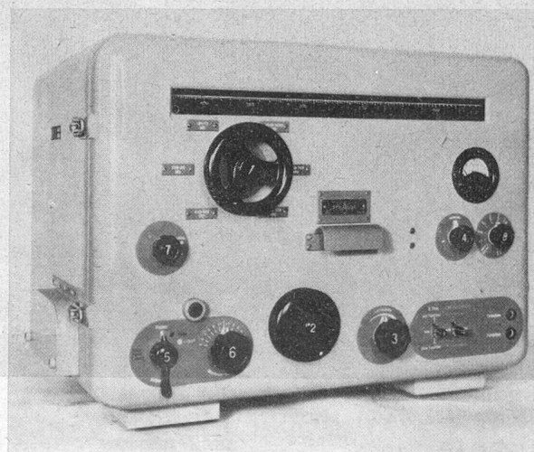
Empfänger zu Grossbereich-Peilanlage für den Flugsicherungsdienst

WERKE FÜR TELEPHONIE UND PRÄZISIONSMECHANIK GEGRÜNDET 1852 TELEPHON 64