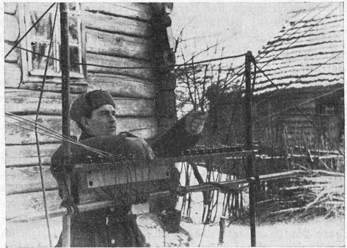
Bei einer deutschen Nachrichtenkompanie an der Ostfront Am Abspannbock

Die unübersehbare Tatsache, dass unsre Bergtäler sich langsam entvölkern, gibt jedem Schweizer zu denken, ist doch der Bergler die Urgestalt, die unsre Geschichte belebt. Es haben sich deshalb auch alle massgebenden Instanzen mit diesem Problem befasst und eine tatkräftige Hilfe hat bereits eingesetzt. Wo liegt eigentlich die Ursache, dass die Alpen veröden? Es sind vorwiegend berufliche Gründe, die den Bauer zur Aufgabe seines Berghofs bewegen, da er, wie er sagt, sein Auskommen nicht mehr findet. Es liegt auf der Hand, dass demnach auch die Hilfsmassnahmen dahin zielen, eine Steigerung der Rentabilität zu erreichen.