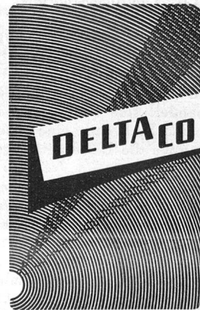
SCHWEIZ. PRÄZISIONSSCHRAUBENFABRIK UND FASSONDREHEREI SOLOTHURN

Die Broschüre „Appara- tenkenntnis für die Tf- Mannschaften aller Truppengattungen“ kann zum Preise von Fr. 1.50 (plus 10 Rp. Porto) bei der Red. des „PIONIER“ bezogen werden (Post- check VIII 15666).