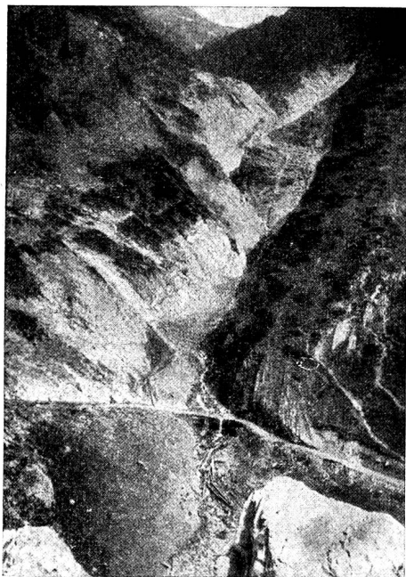
Teilansicht des Lawinengrabens.

HA. Die Berner Alpenbahn Bern-Lötschberg-Simplon (BLS) führt durch eine grosse Zahl von Lawinenzügen, die dank kostspieliger und zweckmässiger Verbauungen die Eisenbahn nicht mehr gefährden. Der Lawinenzug in Mahnkinn bereitete dagegen den Organen der Lötschbergbahn immer besonders grosse Sorgen, die erst durch die nachfolgend beschriebene Sicherungsanlage gründlich behoben werden konnten. Dieser Lawinenzug weist besondere Tücken auf in der Form von zwei untereinanderliegenden Mulden. Eine erste Lawine muss zuerst die obere Mulde füllen, damit eine folgende Lawine die untere füllen kann. Erst wenn diese beiden Mulden mit Lawinenschnee aufgefüllt sind, kann eine dritte Lawine mit grosser Macht darüber hinweggleiten und den Bahnkörper erreichen. Lawinenverbauungen sind hier gar nicht möglich. Es blieb daher nichts anderes übrig, als die Züge selbst vor der tückischerweise immer während der Nacht sich loslösenden Lawine zu schützen.