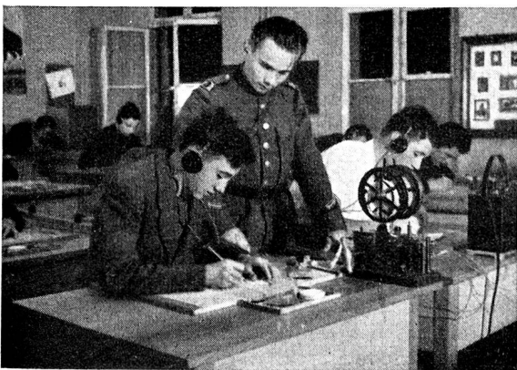
Jungfunker im Theoriesaal. — Im Vordergrund ein Morsefarbschreiber zur Kontrolle des Tasterspiels

Seit 1927 hat sich der EPV, ehemals EMFV, zur Hauptaufgabe gemacht, die angehenden Funkerrekuten so vorzubilden, dass sie während der Rekrutenschule zu einsatztüchtigen Funkern ausgebildet werden können. Damals schon bestand die Notwendigkeit, vor der Rekrutenschule mit der Ausbildung im Morse zu beginnen. Heute, da die Uebermittlung auf funktechnischem Wege aus einer Armee nicht mehr wegzudenken ist, muss der Ausbildung noch viel mehr Aufmerksamkeit geschenkt werden. Dazu kommt noch der Umstand, dass die Funkertruppen der schweizerischen Armee um ein ganz bedeutendes Mass vergrössert worden ist.