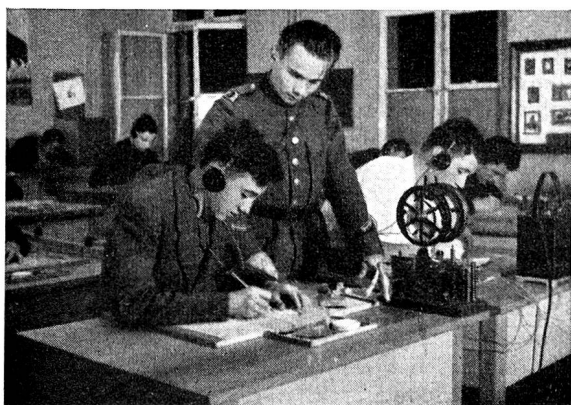
Jungfunker im Theoriesaal. — Im Vordergrund ein Morse-Farbschreiber zur Kontrolle des Tasterspiels

Seit 1927 hat sich der EPV, ehemals EMFV, zur Hauptaufgabe gemacht, die angehenden Funkerrekuten so vorzubilden, dass sie während der Rekrutenschule zu einsatztüchtigen Funkern ausgebildet werden können. Damals schon bestand die Notwendigkeit, vor der Rekrutenschule mit der Ausbildung im Morsen zu beginnen. Heute, da die Uebermittlung auf funktechnischem Wege aus einer Armee nicht mehr wegzudenken ist, muss der Ausbildung noch viel mehr Aufmerksamkeit geschenkt werden. Dazu kommt noch der Umstand, dass die Funkertruppen der schweizerischen Armee um ein ganz bedeutendes Mass vergrößert worden ist.