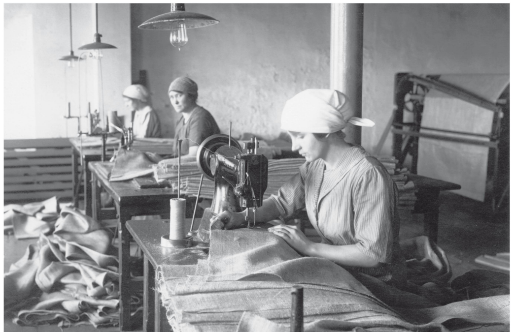
Pendant des décennies les sacs en toile de jute furent les emballages standard du sel. Ils étaient cousus à la main dans la saline, photo datant de 1925.

Les propriétaires décidèrent alors de vendre la saline. Pour cela, la valeur devait être rehaussée au maximum. Une possibilité eut été d'ajuster la part de Schweizerhalle à la production totale des quatre salines du Rhin, ce que refusèrent les salines argoviennes. Afin d'éviter tout autre conflit, Hugo