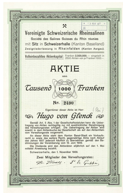
Une action du paquet d'Hugo von Glenck.

Après d'innombrables négociations, la société par actions «Société des salines Suisses du Rhin réunies» fut bap-