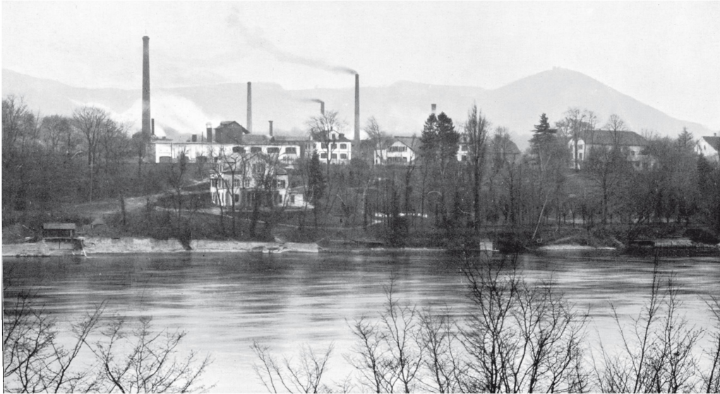
Saline de Schweizerhalle, vue de la rive allemande du Rhin, 1909.

Les ouvriers transportaient le sel dans «des baquets en bois» jusqu'aux silos et le déversaient d'une adroite rotation du corps. Les débutants, encore maladroits, tombaient parfois dans le silo pour le plus grand plaisir des anciens ouvriers.