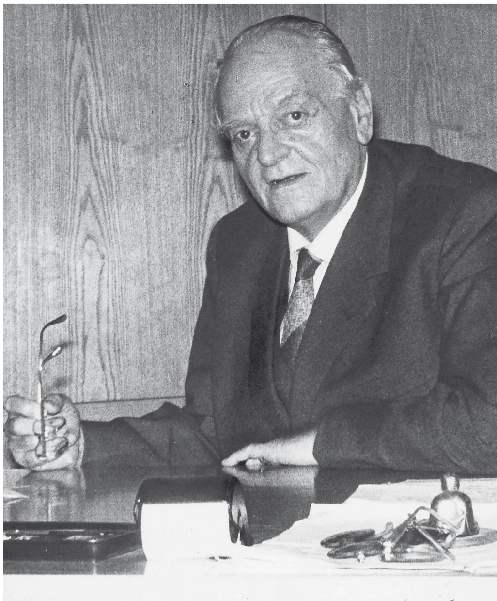
La dernière photo de Duttweiler dans son bureau, en 1961.

Lorsqu’il songe au jour où il ne sera plus là, il redoute « moins l’absence d’un homme qui ait la solution à tous les problèmes dans les tiroirs de son bureau que le manque d’audace ».