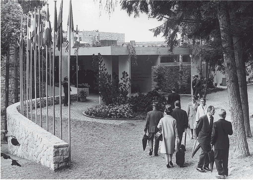
Entrée de l'Institut Gottlieb Duttweiler à Rüschlikon. Gravement malade, Duttweiler en avait posé la première pierre en février 1962.

également conseiller aux Etats zurichois indépendant, renonce, quant à lui, à se mettre sur les rangs. Rudolf Suter, qui a vécu l'histoire de Migros dès la première heure, exerce ses fonctions à l'époque de la croissance illimitée. Il le fait avec diplomatie et réserve, une attitude incontestablement intelligente et indiquée lorsqu'on est appelé à succéder à un personnage de l'envergure de Gottlieb Duttweiler.