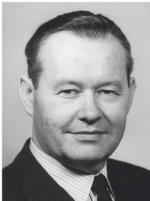
Hans Schaffner (né en 1908), conseiller fédéral de 1961 à 1969.

En réalité, Duttweiler s'est mis à la tâche des années plus tôt. Immédiatement après l'élection au Conseil fédéral de Friedrich Traugott Wahlen, en 1959, il soumet au diplomate responsable des accords commerciaux, le directeur de la Division du commerce et futur conseiller fédéral radical Hans Schaffner, une offre dûment motivée. En examinant cette lettre manuscrite de dix pages, on est frappé d'emblée par la mention de deux dates différentes sur les feuillets (31 mai, juin), ce qui laisse supposer que Duttweiler y a travaillé plusieurs jours. Ensuite, ce document révèle toute l'importance qu'il attache au fait de trouver une personnalité politique plutôt que simplement un top manager pour lui confier sa succession. Le vieux militant intraitable cherche à la fin de sa carrière à entretenir des relations plus détendues entre Migros et les autorités fédérales, et propose à ces dernières non seulement la collaboration de ses spécialistes mais encore leur suggère d'« utiliser l'instrument Migros ».