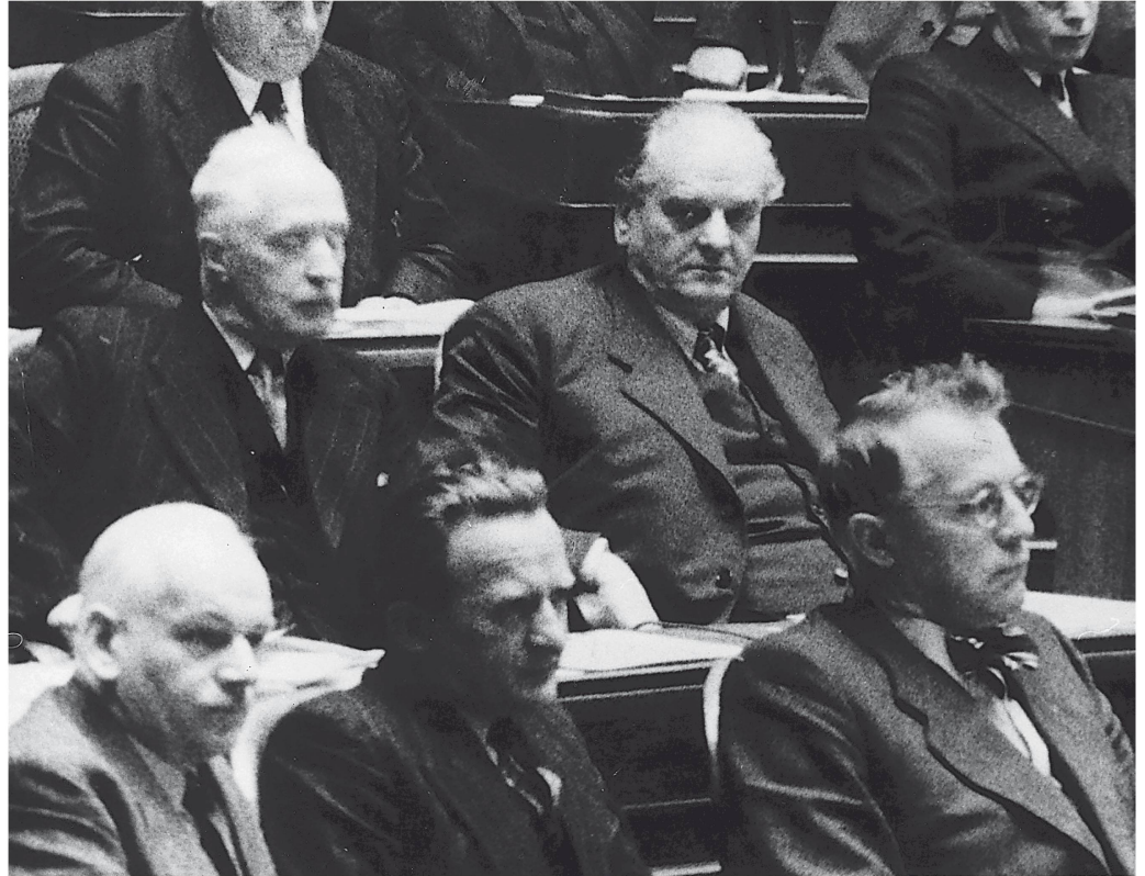
Gottlieb Duttweiler, parlementaire fédéral.

Le succès et l'efficacité sont deux notions bien distinctes, surtout en politique. Si, après le raz-de-marée électoral de 1935, la réussite du politicien Duttweiler est incontestable, en revanche, son impact sur le cours des affaires fédérales restera étroitement limité. Quoi qu'il veuille entreprendre, quoi qu'il cherche à faire bouger, les blocs de gauche et de droite pèsent en permanence de tout leur poids, et peu de choses ne changent dans la réalité suisse. En tant que politicien appartenant à l'opposition et exposé aux piques des deux grands pôles de l'arène politique, il doit réfléchir à deux fois avant d'arrêter les thèmes sur lesquels il va se concentrer et ceux qu'il laissera de côté, même s'il y attache de l'importance.