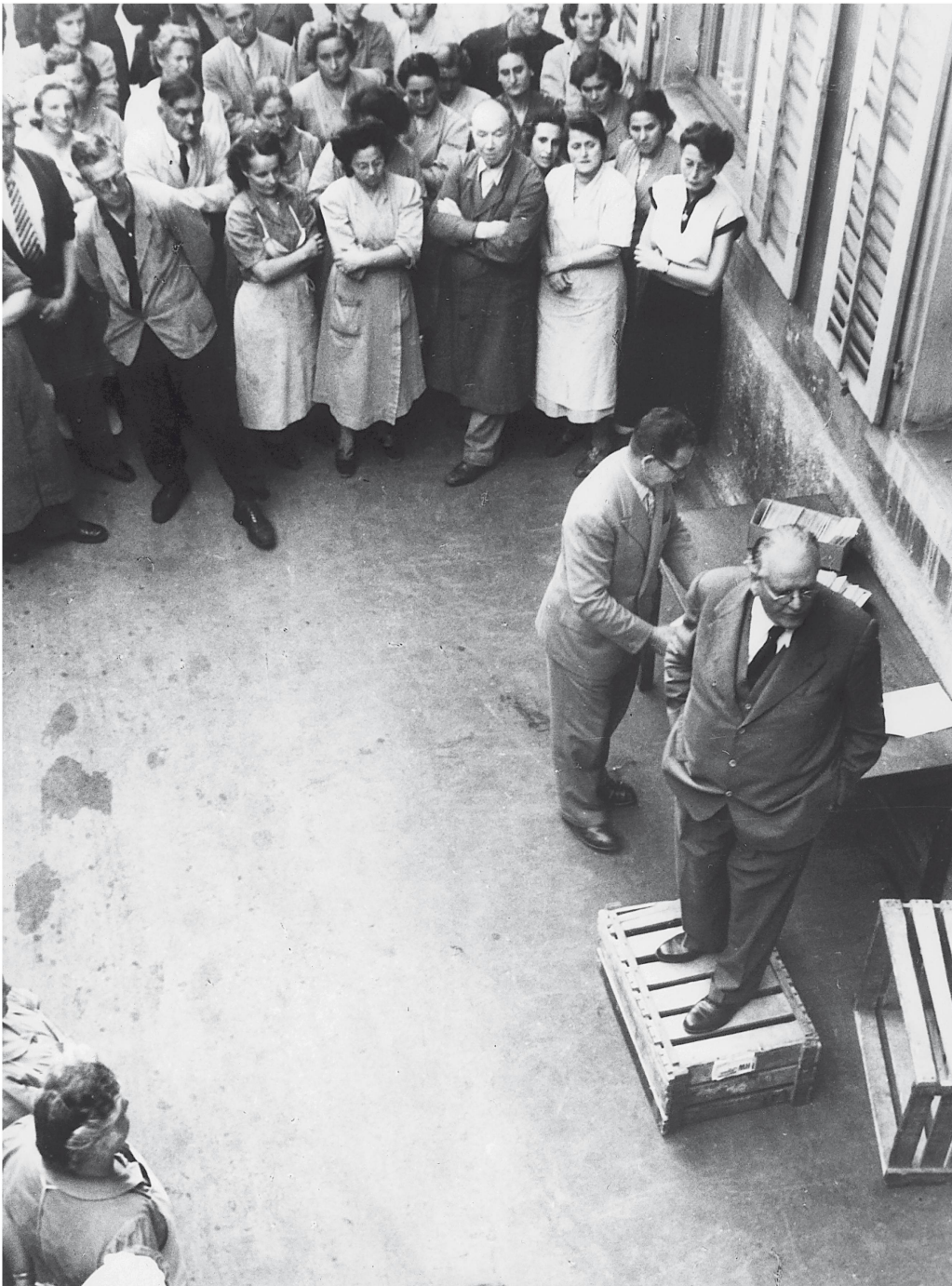
Pour Gottlieb Duttweiler, l'entretien de bons contacts avec le personnel est important.