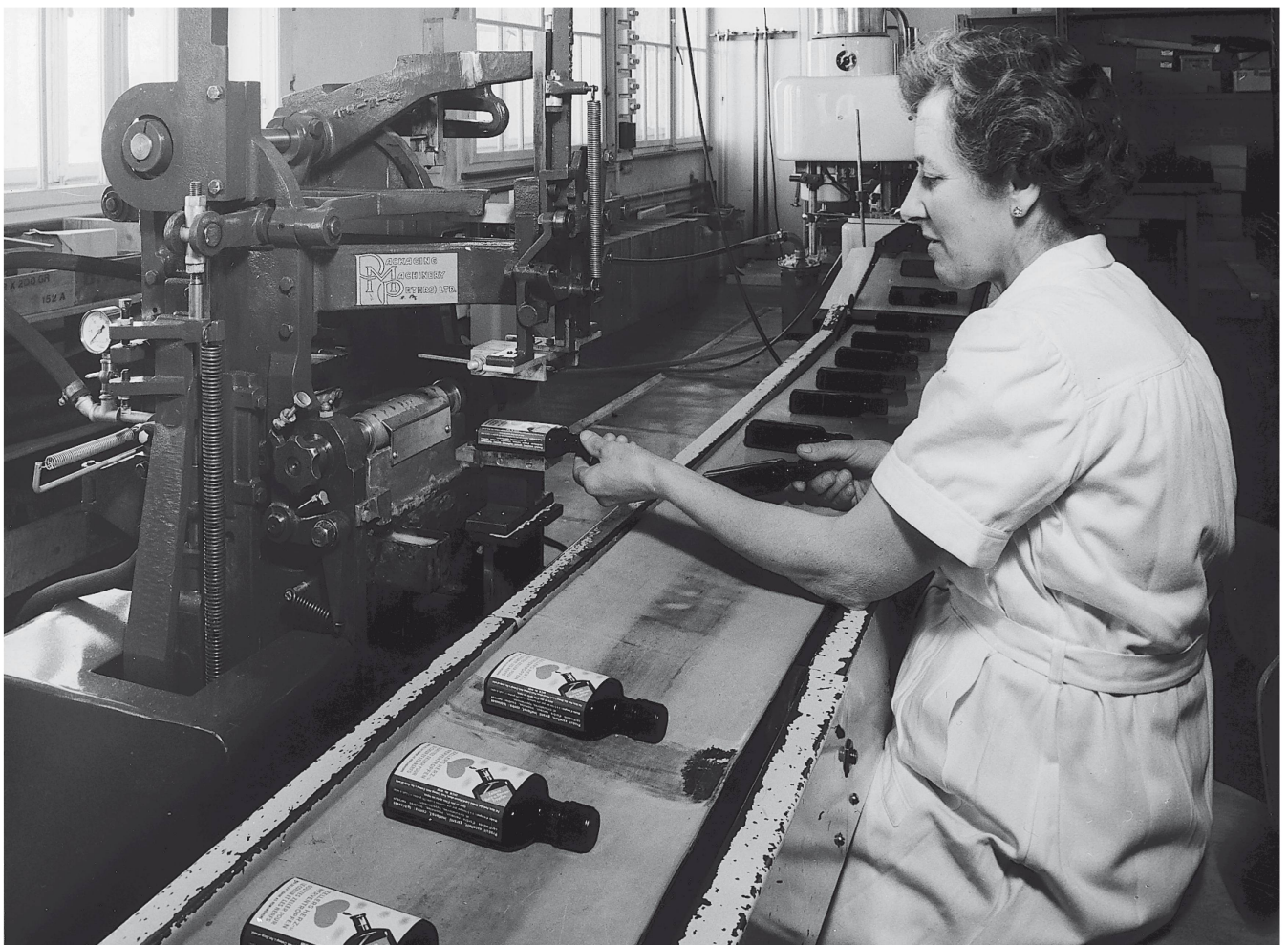
Machine à étiqueter

C'est à cette époque que les bâtiments de la fabrique furent également modernisés, en partie sous la direction d'Erwin Hungerbühler, architecte diplômé à Romanshorn. Une citerne à