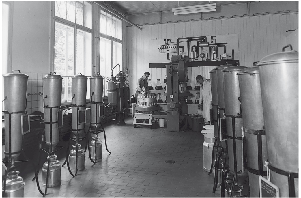
Le laboratoire du Baume Zeller