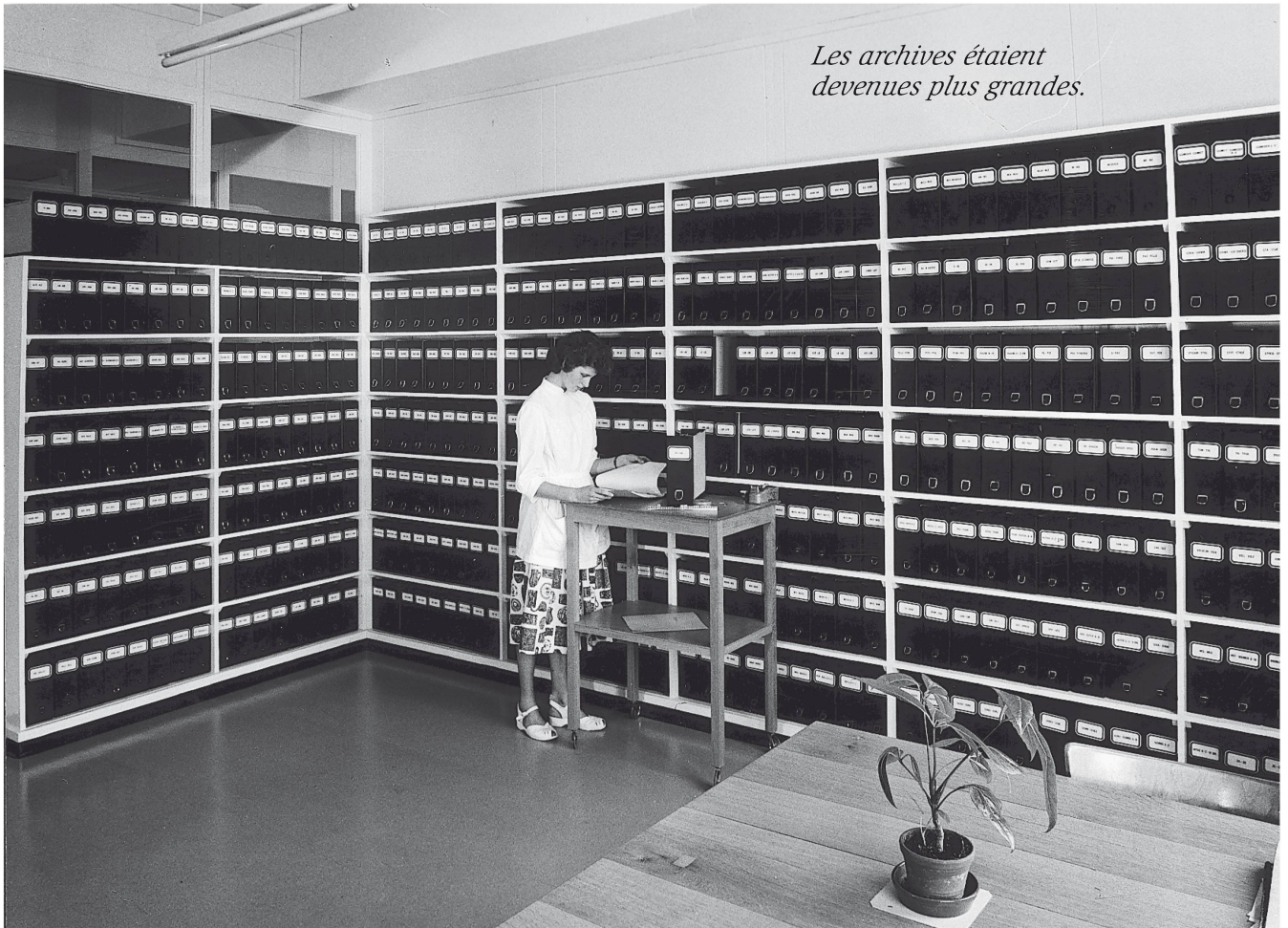
Les archives étaient devenues plus grandes.