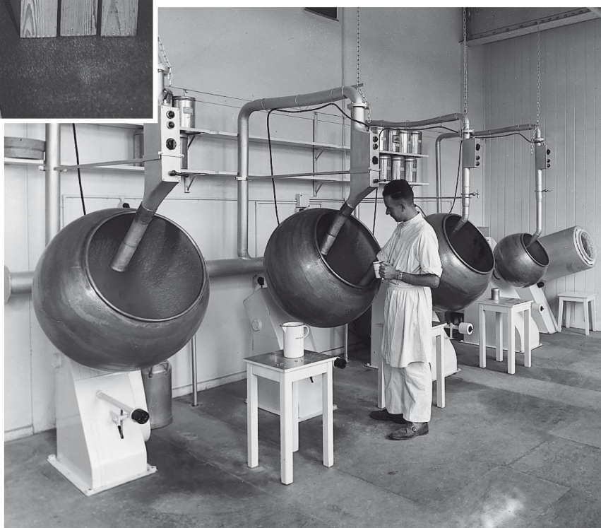
Le nouveau département de dragéeification en 1951