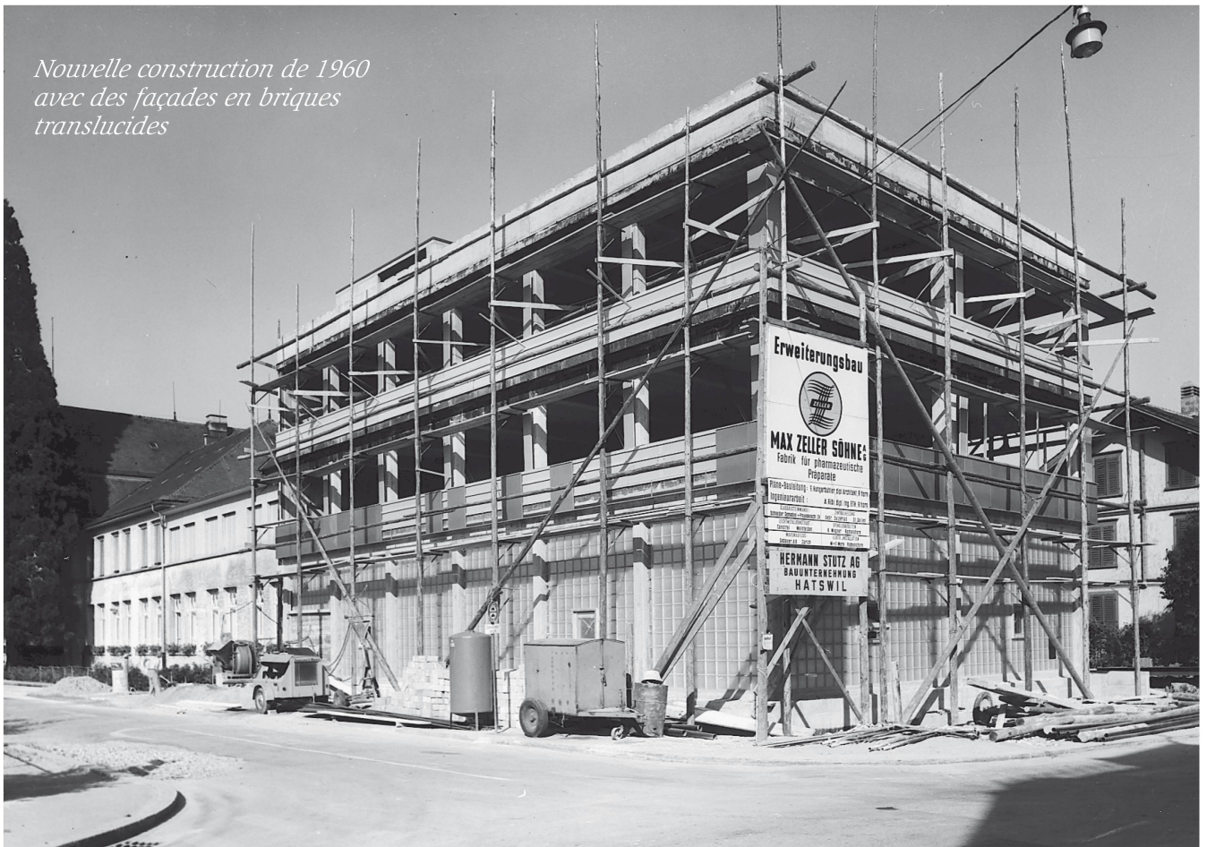
Nouvelle construction de 1960 avec des façades en briques translucides