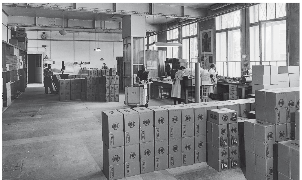
Le département d'expédition pour les envois par train