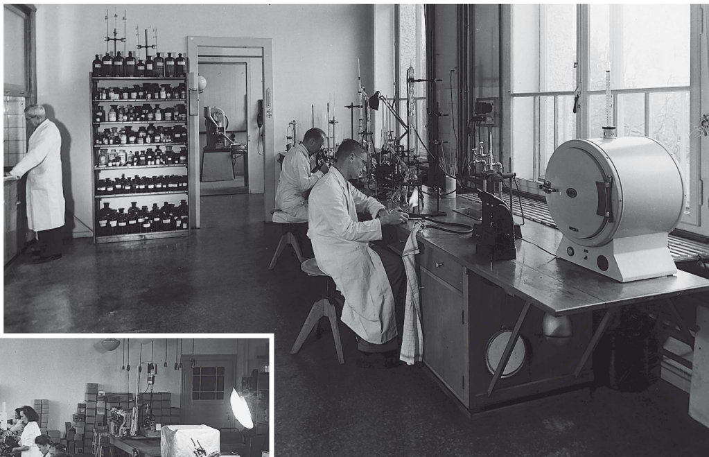
Les laboratoires scientifiques à la fin des années 1940