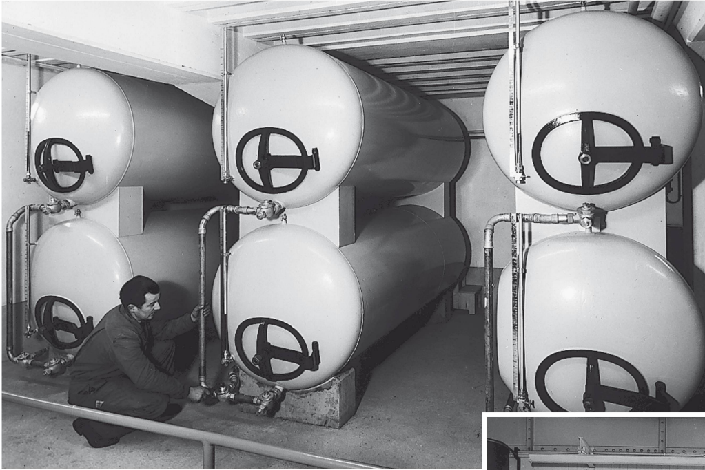
Six cuves de stockage pour des produits finis