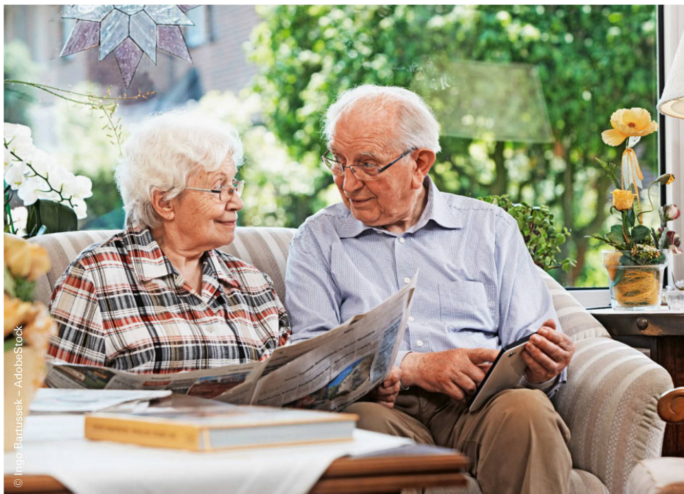
Zu Hause lebende ältere Menschen verbringen im Durchschnitt 80% der Zeit im Sitzen. | Les personnes de plus de 60 ans passent en moyenne 80% de leur temps assises.

gleichzeitig auch dem Bewegungsmangel entgegenwirkt. Sebastien Chastin und seine Kolleg:innen [1] haben daher die Wirkung von Interventionen evaluiert, die speziell darauf abzielen, gegen den Bewegungsmangel bei Personen über 60 Jahren vorzugehen.