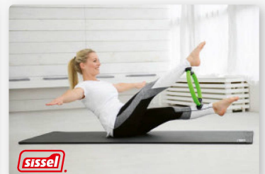
SISSEL Pilates Circle

Produits Pilates de la marque de santé SISSEL