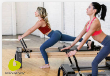
Balanced Body Allegro Reformer

Produits pour un entraînement de groupe dynamique