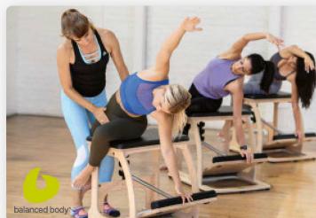
Balanced Body Exo Chair, Single Pedal

Produits pour l'entraînement personnel ou en petits groupes