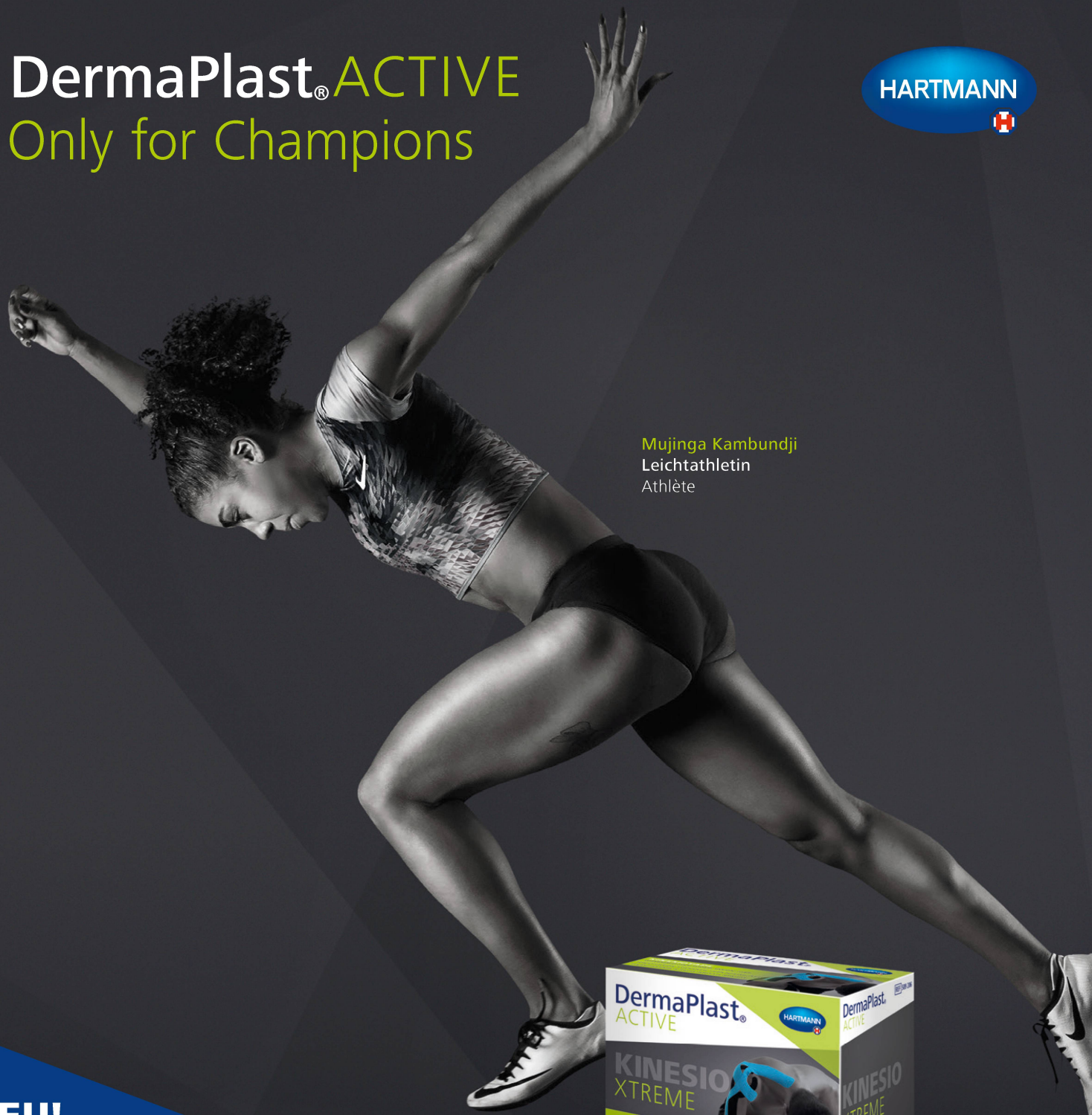
Mujinga Kambundji Leichtathletin Athlète