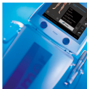
enPulsPro neue Generation

Hocheffiziente Behandlung durch kombinierten Einsatz von Ultraschall und Reizstrom.