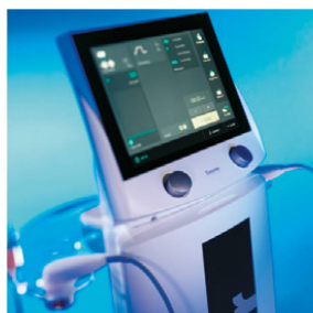
PhySys neue Generation

Ihr exklusiver Ansprechpartner in der Schweiz: