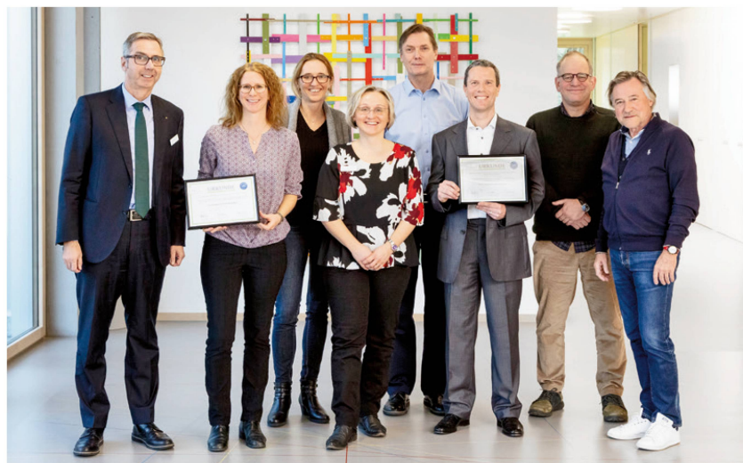
Gruppenbild von der Prämierung (v.l.n.r.): I Photo de groupe de la remise du prix (d. g. à d.): I Foto di gruppo della rimessa del prezzo (da s. a d.):

La clinica Reha Rheinfelden ha assegnato il suo riconoscimento per la ricerca 2019 proprio a due team. Ha premiato il lavoro di un team di ricerca dell'Inselspital di Berna che ha analizzato l'effetto della valutazione e della gestione precoce della disfagia dopo rese-