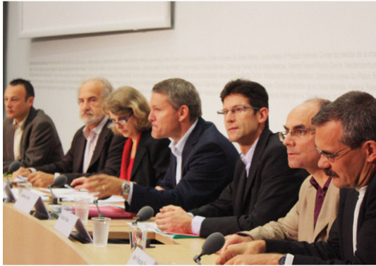
Die Medienkonferenz zur Gesundheitskasse 2014. I La conférence de presse en 2014 sur la caisse de santé. I La conferenza stampa nel 2014 sulla cassa di salute.

Partner einverstanden waren, sie etwas zu öffnen. Heute wäre das nicht mehr möglich.