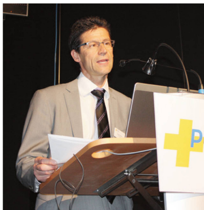
Eröffnung des physiocongress 2014 in Bern. | Ouverture du physiocongress 2014 à Beme. | Apertura del physiocongress 2014 a Berna.

Von der heutigen Warte aus gesehen hatten wir bei der Taxpunkterhöhung politisch grosses Glück. Die Erhöhung ist natürlich nicht ausreichend. Aber wir haben sie in einer Zeit erzielt, wo die Türen einen Spalt offenstanden oder einige