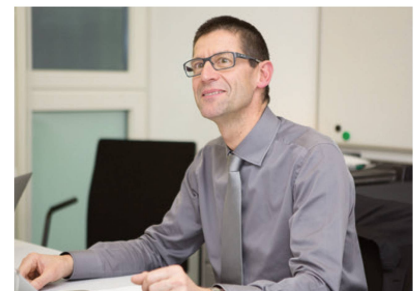
Roland Paillex 2015 an einer Sitzung des Zentralvorstands. | Roland Paillex en 2015 lors d'une séance du Comité central. | Roland Paillex nel 2015 in occasione di una seduta del Comitato centrale.

Roland Paillex: Dal punto di vista psicologico sto bene, anche se la mia vita è stata sconvolta dal gennaio 2018: per vent'anni ho visto da un solo occhio, poi all'improvviso anche la vista dell'occhio sano è scesa d'all'80 al 10%. Ormai appartengo alla categoria delle persone gravemente ipovedenti. Pertanto, non è più possibile per me portare avanti l'incarico di presidente di physioswiss.