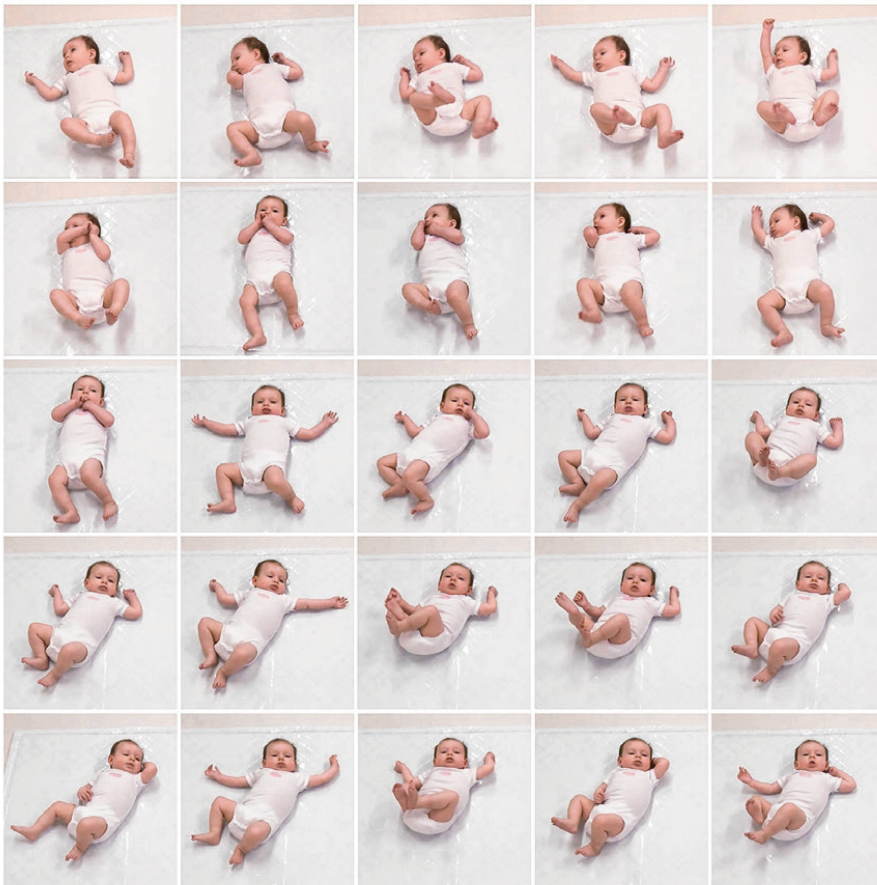
Abbildung 2: Spontanes Bewegungsverhalten im Alter von 3 Monaten (korrigiertes Alter KA). Oben: typische Muster, normale «General Movements». Unten: Stereotypien, deutlich abnorme «General Movements».