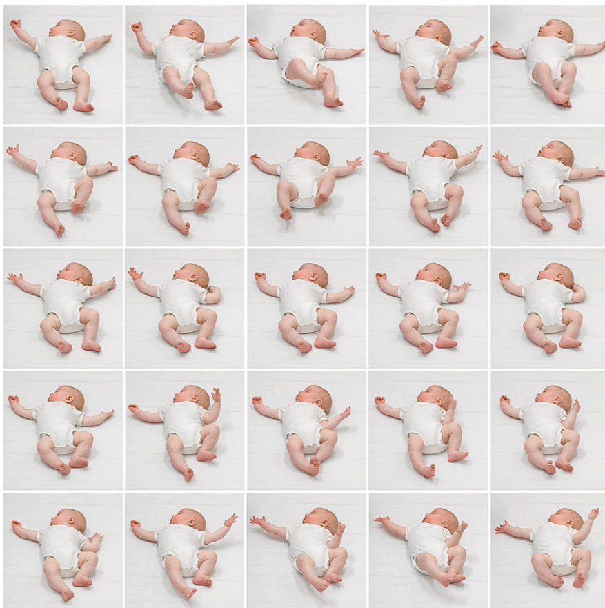
Illustration 2: Comportement spontané en matière de mouvement au 3 e mois (âge corrigé). En haut: schémas typiques, mouvements globaux normaux. En bas: stéréotypie, mouvements globaux nettement anormaux.