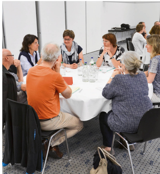
Austausch an den Roundtables zum neuen Kompetenzpool. | Échanges autour des tables rondes sur le nouveau pool de compétences. | Scambi sul nuovo pool di competenze nelle tavole rotonde.

Practice». Im Herbst 2018 läuft die Bewerbung für diese zwei neuen Kommissionen. Der Aufruf für Kommissionsmitglieder wird über den physio-swiss-Newsletter und die Kantonal-/Regionalverbände ausgeschrieben. Die Bewerbungen gehen an den Zentralvorstand, der die Mitglieder wählt.