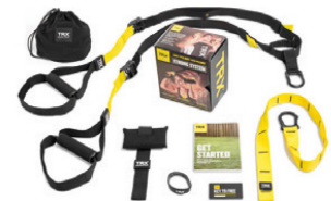
TRX Strong Schlingentrainer

Entscheiden Sie sich für eine MTT-Ausstattung auf höchstem Niveau.