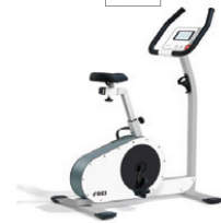
FREI Cycle 200 med