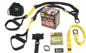
TRX Strong Schlingentrainer

Entscheiden Sie sich für eine MTT-Ausstattung auf höchstem Niveau.