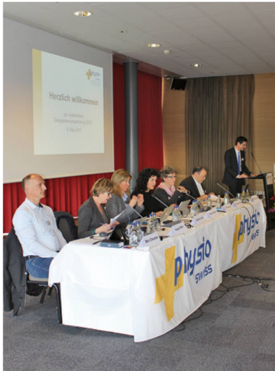
Der Zentralvorstand an der DV 2017. | Le comité central à l'AD 2017. | Il comitato centrale all'AD 2017.