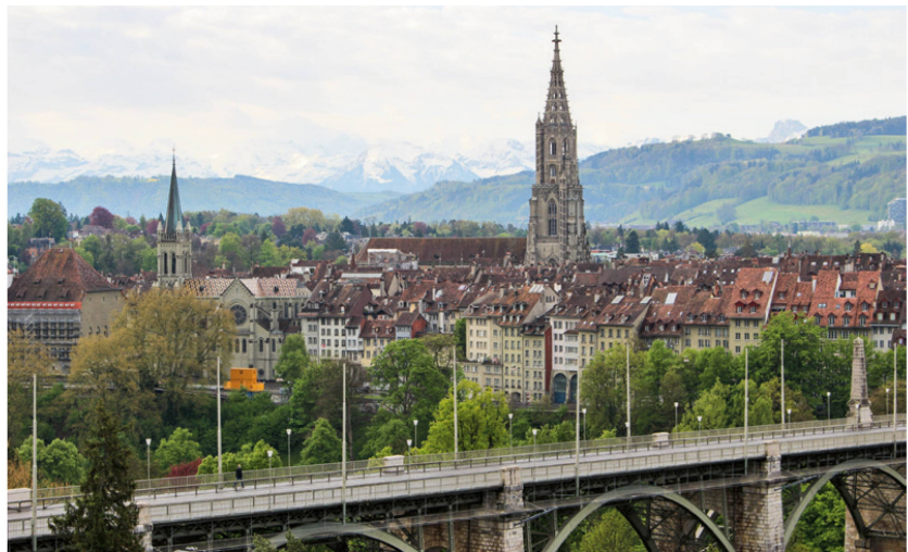
Ausblick vom Tagungsraum. | La vue depuis la salle de conférence. | La vista dalla sala di conferenza.

I 79 delegati presenti hanno vissuto grandi alti e bassi emotivi. Mentre l'assemblea dei delegati ha inizialmente seguito il suo abituale andamento con le trattande usuali come l'approvazione del verbale, del rapporto annuale nonché del bilancio e del conto economico,