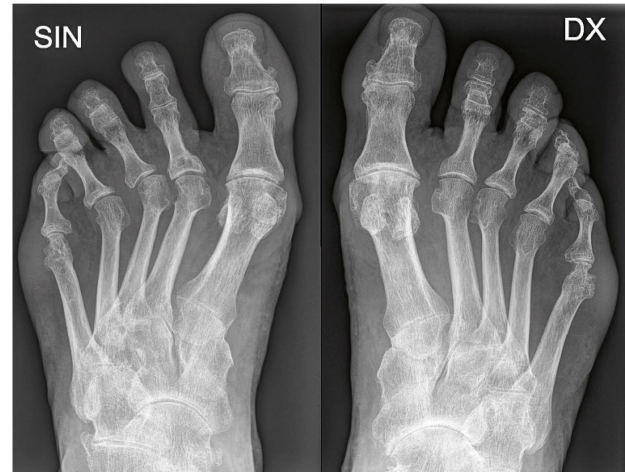
Füsse: Erosionen führen zu Deformation und sekundären Arthrosen. | Pieds: les érosions ont conduit à une déformation et à de l'arthrose secondaire.

Mit der Einführung zielgerichteter Behandlungsstrategien, die direkt ins Krankheitsgeschehen eingreifen, soll der Anteil Patienten in Remission oder mit geringer Krankheitsaktivität erhöht werden. Langfristig besteht die Hoffnung, dass sich der Outcome von Patienten mit rheumatischer Arthritis erheblich verbessert.