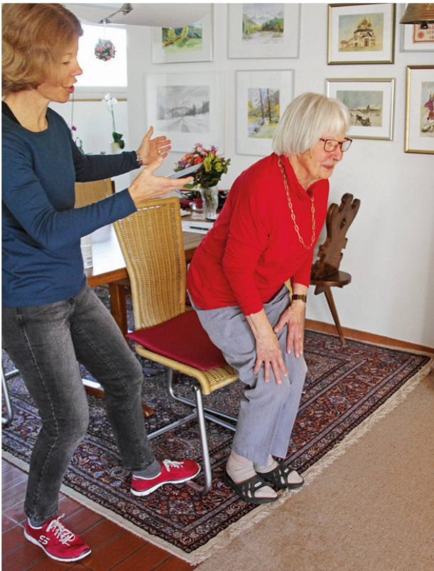
Der «Five Chair Rising Test» erfasst das Sturzrisiko. | Le «Five Chair Rising Test» permet d'évaluer le risque de chute.