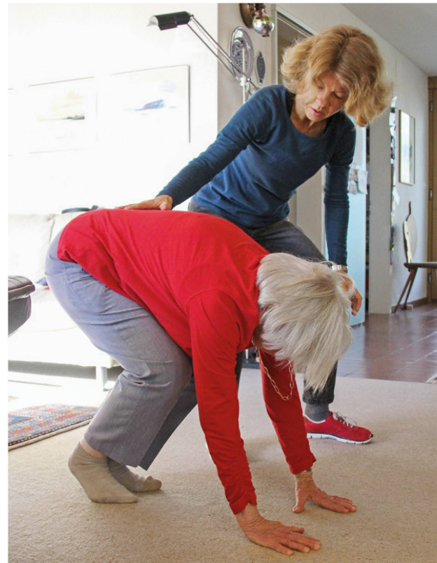
Kann die Seniorin wieder alleine vom Boden aufstehen? | La personne âgée est-elle en mesure de se relever seule?