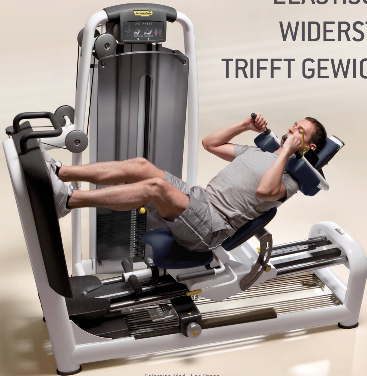
Selection Med - Leg Press