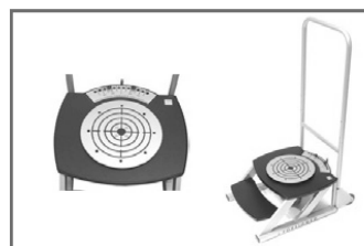
Bioswing Torsiomed CHF 1490.00