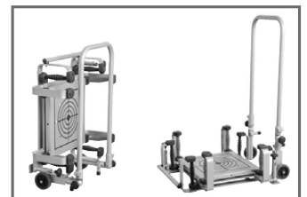
Bioswing Posturomed C CHF 1370.00