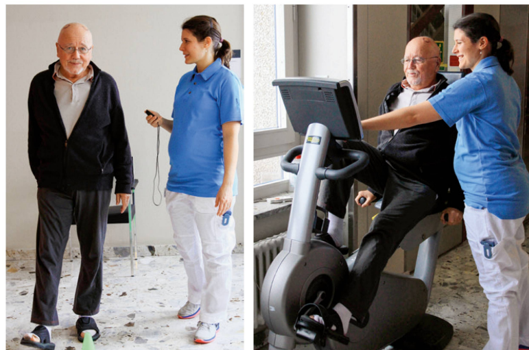
Patient beim Assessment in der präoperativen Abklärung. | Un patient lors de l'examen préopératoire.

Le but de la physiothérapie est d'évaluer l'influence des paramètres DBS sur l'équilibre, le contrôle de la posture et l'assurance de la démarche et, d'autre part, d'éviter