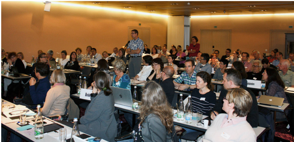
Zahlreiche Fragen der Delegierten wurden an der DV vollumfänglich beantwortet. | Les nombreuses questions des délégués ont reçu des réponses détaillées. | L'assemblea risponde in modo esaustivo a molte domande dei delegati.

insbesondere bei den Kommunikationsmassnahmen. Dies ist in Anbetracht der stetig wachsenden Anzahl von juristischen Personen ein Problem. Der Zentralvorstand schlug den Delegierten vor, dass er mit der Geschäftsstelle auf die DV 2016 konkrete Vorschläge für die Änderung der Statuten ausarbeiten wird – was mit nur einer Enthaltung durchwegs wohlwollend aufgenommen wurde.