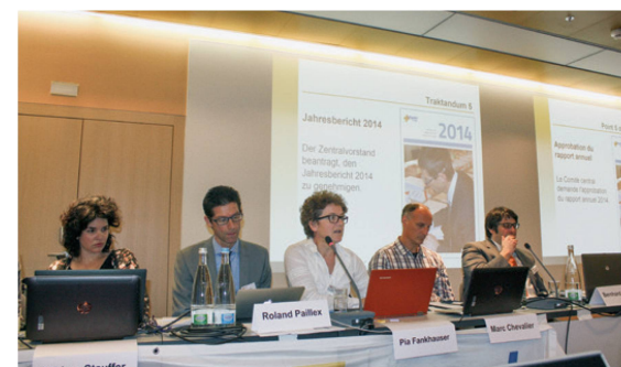
Der Zentralvorstand informiert die Delegierten. | Le Comité central communique des informations aux délégués. | La Presidenza centrale comunica informazioni ai delegati.

Il piano contabile del conto annuale è stato impostato sul nuovo anno. Ora ci si orienta al quadro dei conti delle piccole e medie imprese. Questo ha permesso di sistematizzare la contabilità e di adattarla alle nuove disposizioni