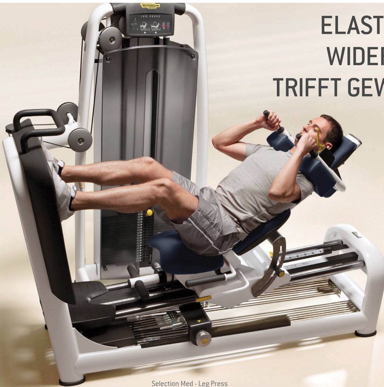
Selection Med - Leg Press