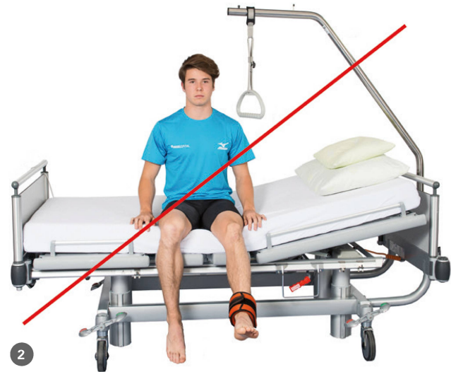
Ein Training in offener Muskelkette ist die ersten drei Monate in der Nachbehandlung einer DIS nicht empfohlen. | L'entraînement en chaîne musculaire ouverte est déconseillé lors des trois premiers mois du traitement d'une DIS.

der muskulären Kniegelenksstabilisatoren zu langsam erfolgt und die Kräfteinwirkung die Reissfestigkeit von 2400 N überschreitet. Dies passiert vor allem beim Skifahren aufgrund hoher Geschwindigkeiten und/oder Ermüdung der Muskulatur. Ausserdem weisen körperkontaktbetonte Sportarten wie Handball und Fussball sowie Kampfsportarten ein besonders hohes Verletzungsrisiko auf. Je nach Richtung der Kräfteinwirkung und der Intensität können weitere Strukturen verletzt sein.