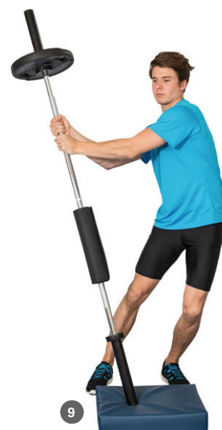
Phase 3: Muskelaufbau unter Vollbelastung und sensomotorische Kontrolle (Foto 7–9). | Phase 3: Musculation à pleine charge et contrôle sensori-moteur (photo 7–9).