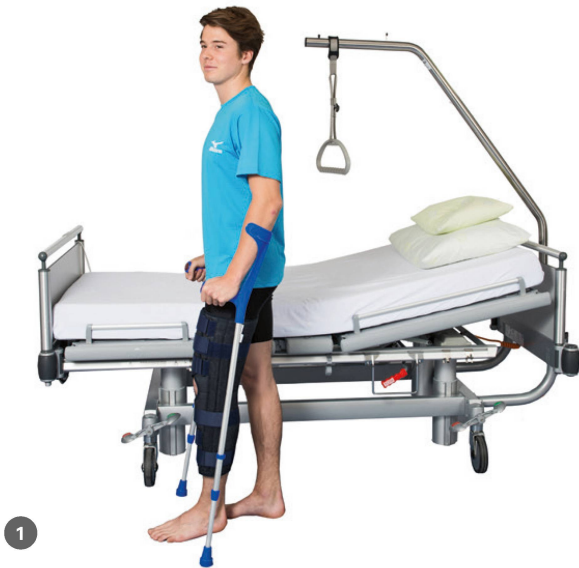
Phase 1: Fixe Orthese in Extension. | Phase 1: Une attelle fixe en extension.