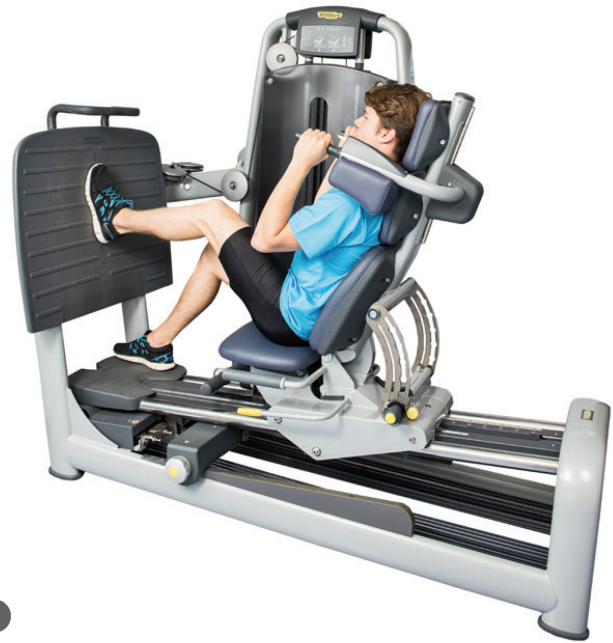
Phase 2: Ergometer-Training. | Phase 2: Entraînement sur un ergomètre.