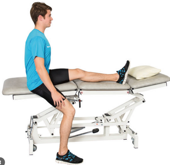
Phase 2: Aktive Extension im Langsitz (verhindert Zug auf vordere Schublade). | Phase 2: Extension active, jambe tendue en appui (évite le tiroir antérieur).