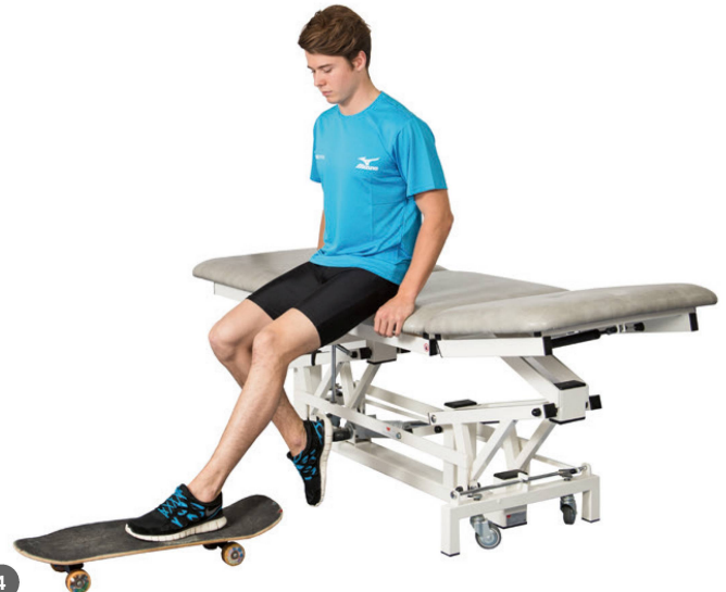
Phase 2: Aktive Mobilisation. | Phase 2: Mobilisation active.

jedoch innert den ersten 21 Tagen erfolgen, solange durch die frische Verletzung noch Wachstumshormone vorhanden sind.