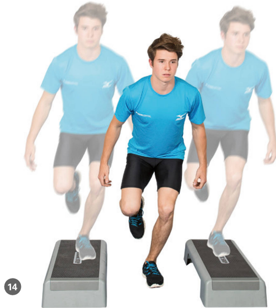
Phase 5: Sportartspezifisches Training (Foto 13–14). | Phase 5: L'entraînement spécifique à la discipline sportive (photo 13–14).